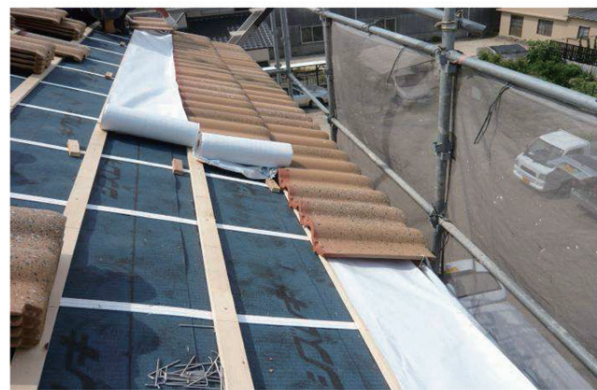
④ クールルーフシートと瓦を1列毎に施工してください。シートはすべりやすいため上は歩かないでください。