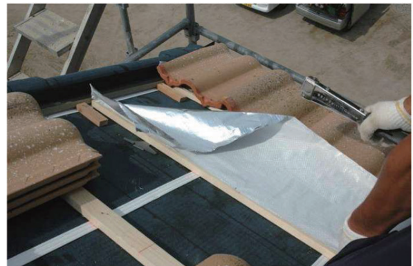
② 軒先の瓦を施工します。次に2段目の瓦棧にクールルーフシートを留めます。