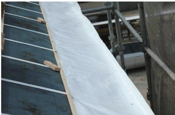
① 軒先1段目にクールルーフシート(アルミ面を下)を瓦棧と鼻棧にタッカー留めます。