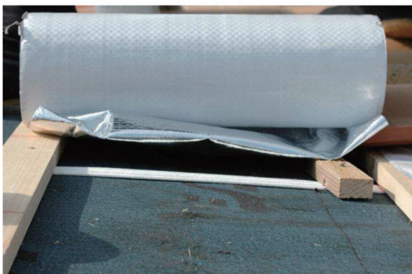
③ クールルーフシートと野地との間には必ず空間(空気層)を設けてください。